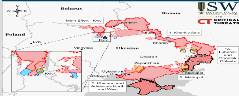
Assessed Control of Terrain in Ukraine and Main Russian Maneuver Axes as of March 24, 2023, 3:00 PM ET